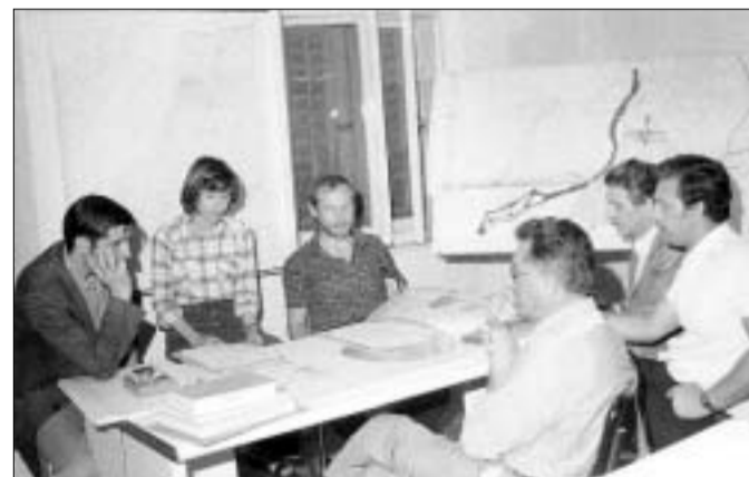
Posveti inštituta v Gorici malo po ustanovitvi