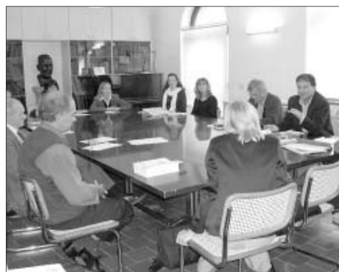
V Cedadu je bil letos eden izmed številnih Slorijevih posvetov